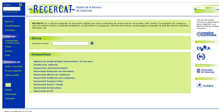
Figura 2: Portada de RECERCAT