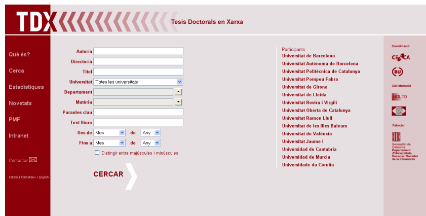
Figura 1: Portada de TDX

La consulta de les tesis és lliure i no és necessària cap clau d'entrada al sistema. Els drets de l'autor de la tesi queden protegits mitjançant un contracte. La integritat del text queda garantida per les opcions de seguretat que incorpora el format d'emmagatzematge emprat: PDF.